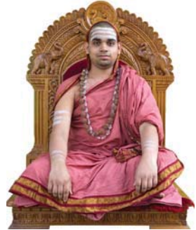
జగద్గురు శ్రీ విధుశేఖర భారతీ మహాస్వామినః

పంచాంగమిదం - శ్రీమచ్చింతలపాటివంశ పయః పారావార రాకాసుధాకర, “విద్యదైవజ్ఞభాస్కర”