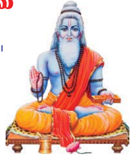
భగవాన్ శ్రీ వేదవ్యాస మహర్షిః

శ్లో॥ శుద్ధస్పటిక సంకాశం శుద్ధ విద్యా ప్రదాయకం । శుద్ధం పూర్ణం చిదానందం సదాశివమహం శ్రయే ॥ శ్లో॥ సీమాతీతమనాద్యంతం నామోచ్ఛారణ భేషజం । కామితాశేషఫలదం శ్రీమద్విష్ణుమహం శ్రయే ॥ శ్లో॥ యోగిహృత్పద్మనిలయం నత జీవ హితే రతం । శ్రుతీనాం జన్యభూమిం త్వం చతుర్ముఖమహం శ్రయే ॥ శ్లో॥ ప్రసమాహితమత్యంతం ప్రథిమామిత తేజసం । వశీకృతపరానందం వసిష్ఠం గురుమాశ్రయే ॥ శ్లో॥ శుక్టో రూప్యమివాభాతి యద్రూపం మయి కల్పితం । శక్త్యా పరిహృతం యేన శక్తిం తం గురుమాశ్రయే ॥ శ్లో॥ కరణాతీతచిద్రూపం పరిపూర్ణం పరాయణం । పరమానందసంతుష్టం పరాశరమహం శ్రయే ॥ శ్లో॥ వేదవ్యాసం స్వాత్మరూపం సత్యసంధం పరాయణం । శాంతం జితేంద్రియక్రోధం సశిష్యం ప్రణమామ్యహమ్ ॥ శ్లో॥ త్రికాలాతీతచిన్మాత్ర ప్రశాంతస్వాంతసంయుతం । వికారాద్యైరసంస్పృష్టం శుకం గురుమహం శ్రయే ॥ శ్లో॥ గూఢా మాయా యస్య వాక్యైర్వీడితా విలయం గతా । క్రీడంతం విద్యయా సార్థం గౌడపాదం తమాశ్రయే ॥ శ్లో॥ జీవేశభేదరహితం నావికం భవవారిధిః । భావాభావ విదురస్థం గోవిందం గురుమాశ్రయే ॥