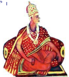
జగద్గురు శ్రీ సచ్చిదానంద భారతీ మహాస్వామినః