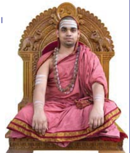
జగద్గురు శ్రీ విధుశేఖర భారతీ మహాస్వామినః