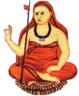
జగద్గురు శ్రీ విద్యారణ్య మహాస్వామినః