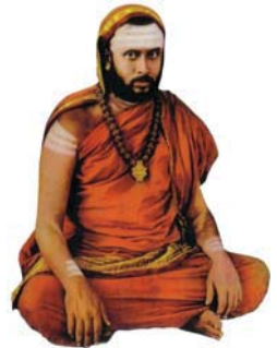
జగద్గురు శ్రీ చంద్రశేఖర భారతీ మహాస్వామినః