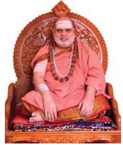
జగద్గురు శ్రీ భారతీత్పిఠ మహాస్వామినః