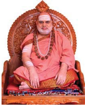
జగద్గురు శ్రీ భారతీతీర్థ మహాస్వామినః