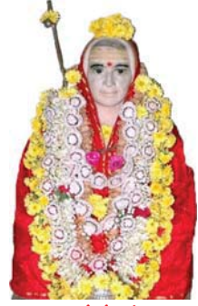
జగద్గురు శ్రీ సురేశ్వరాచార్యః

శ్లో॥ శంకారూపేణ మచ్చిత్తం పంకీకృతమభూద్యయా । కింకరీ యస్య సా మాయా శంకరాచార్యమాశ్రయే ॥ శ్లో॥ విశ్వం మాయామయత్యేన రూపితం యత్రబోధతః । విశ్వం చ యత్స్వరూపం తం వార్తికాచార్యమాశ్రయే ॥ శ్లో॥ అనాద్యవిద్యాముత్సార్య ప్రజ్ఞానఘనరూపతాం । యో బోధయతి సచ్చిష్యాన్ తం బోధఘనమాశ్రయే ॥ శ్లో॥ సితాఘనాది దృష్టాంతైః యత్స్వరూపం శ్రుతిర్లగౌ । ప్రజ్ఞానఘన ఏవేతి తం జ్ఞానఘనమాశ్రయే ॥ శ్లో॥ జ్ఞానానాముత్తమం జ్ఞానం జ్ఞానినాముత్తమో యతః । జ్ఞానోత్తమ ఇతిఖ్యాతం గురుం తమహమాశ్రయే ॥ శ్లో॥ జ్ఞాననిశ్చేణిమాలంబ్య బ్రహ్మీఖ్యం గిరిమున్నతం । ఆరుహ్య కృతకృత్యే యః తం జ్ఞానగిరిమాశ్రయే ॥ శ్లో॥ దుర్వాది దుష్టమాతంగవిదారణ పఠీయసే । నమశ్శ్రీ సింహగిరయే గురవే దివ్యచక్షుషే ॥ శ్లో॥ ఈప్పితార్థప్రదో నిత్యం ప్రణతానాం చ దేహినాం । యతిరీశ్వరతీర్థాఖ్యః తం నమామి గురుం శివమ్ ॥ శ్లో॥ శ్రుతిమస్తక కూటస్థమజ్ఞానద్విపభేదినం । శ్రీ మంత్రరాజమూర్తిం తం నృసింహం గురుమాశ్రయే ॥ శ్లో॥ అవిద్యాచ్చన్నభావానాం నృణాం విద్యోపదేశతః । ప్రకాశయతి యస్తత్వం తం విద్యాతీర్థమాశ్రయే ॥ శ్లో॥ అజ్ఞానాం జాహ్నువీ తీర్థం విద్యాతీర్థం వివేకినాం । సర్వేషాం సుఖదం తీర్థం భారతీతీర్థమాశ్రయే ॥ శ్లో॥ అవిద్యాఽరణ్య కాంతారే భ్రమతాం ప్రాణినాం సదా । విద్యామార్గోపదేశ్చారం విద్యారణ్య గురుం శ్రయే ॥ శ్లో॥ విద్యాఽవిద్యావివేకేన పారం సంసార వారిధేః । ప్రాపయత్యనిశం భక్తాన్ తం విద్యారణ్యమాశ్రయే ॥ శ్లో॥ అవిద్యారణ్య సంక్షేప కృశాసు భృశతాపితః । సంశ్రయే సతతం భూత్వై చంద్రశేఖర చంద్రికామ్ ॥ శ్లో॥ అవిద్యాఽఖ్య ద్విపద్వైధీభావే దక్షం సమాశ్రయే । నృసింహభారతీశాఖ్య హరిం శ్రుతిగుహాశ్రయమ్ ॥ శ్లో॥ పురుషోత్తమతాం యాంతి యమాశ్రిత్య జనాశ్రయే । క్షరాక్షరమతీతం తం పురుషోత్తమ యోగినమ్ ॥