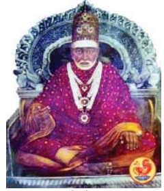
జగద్గురు శ్రీ నృసింహ భారతీ మహాస్వామినః

శ్లో॥ కింకరీకృత భూపాలం పంకేరుహ సమాననం । తం కారుణ్యపయోరాశిం శంకరాఖ్యం గురుం శ్రయే ॥ శ్లో॥ చంద్రికాధవళోదార సాంద్రకీర్తిచ్ఛటాధరం । ఇంద్రియైర్దుర్లయం నౌమి చంద్రశేఖర భారతీమ్ ॥ శ్లో॥ ప్రసిద్ధ విద్యానిలయమసమాన గుణోత్కటం । బిసజాక్షార్చకం భక్త్యా నృసింహం తీర్థమాశ్రయే ॥ శ్లో॥ పురుహూతాది దేవౌఘ పౌరుషేయ గుణోత్కటం । పురుషార్థప్రదం నౌమి పురుషోత్తమ యోగినమ్ ॥ శ్లో॥ కామద్వీరద పంచాస్యరామణీయక మందిరం । సోమోపమాననం శ్రీమద్రామచంద్ర గురుం భజే ॥ శ్లో॥ సురసింధు లసత్కీర్తిం స్మరసింధుఘటోద్భవం । నారసింహోర్చకం శ్రీమన్నారసింహ యతిం భజే ॥ శ్లో॥ సారాసార వివేకజ్ఞం మారకాననకుంజరం । శూరం దానే చ నిరతం నారసింహయతిం భజే ॥ శ్లో॥ నృసింహతాం ప్రయాంత్యాశు యమాశ్రిత్య జనా భువి । తం నృసింహగురుం వందే ద్విగుణోపపదం సదా ॥ శ్లో॥ తం సర్వభూతాభయదం విభవైరన్వితం పరం । నారసింహం గురుం చాపి నవం జ్ఞానార్ణవం భజే ॥ శ్లో॥ సత్యస్వరూపం సజ్ఞాన నిష్ఠం సాక్షాచ్ఛివం పరం । సదా దానరతం దాంతం సచ్చిదానందమాశ్రయే ॥ శ్లో॥ మహామేరు సమం ధైర్యే మాధుర్యేఽప్యమృతోపమం । ఊహాపోహార్థ నిష్ఠాతం నారసింహ గురుం భజే ॥ శ్లో॥ సచ్చిత్తాంబుజ మిత్రాయ సచ్చురిత్రయుజే నమః । సచ్చిదానంద భారత్యై సచ్చిదానంద మూర్తయే ॥ శ్లో॥ సచ్చిదానంద భారత్యై నవ్యాయాస్తు నమోఽనిశం । భవ్యాత్మ జ్ఞాన నిర్ఘోతావిద్యా కార్యోపలబ్ధయే ॥ శ్లో॥ మార మాతంగ పంచాస్యం మదసర్ప ద్విజర్షభం । నృసింహ భారతీం వందే జితాక్ష తురగం సదా ॥ శ్లో॥ తత్త్వమస్యాది వేదాంత వాక్యార్థ జ్ఞాన వారిధిః । పూర్ణ చంద్రమసం వందే సచ్చిదానంద యోగినమ్ ॥ శ్లో॥ అభినవ పద పూర్వాన్ సచ్చిదానంద సంజ్ఞాన్ నిగమ శిఖర వేద్యాన్ నిత్య కళ్యాణ రూపాన్ । త్రిభువన జన వంద్యాన్ సర్వ లోకైక హృద్యాన్ హృదయ కమల మధ్యే భావయామ్యంబుజాఽస్యాన్ ॥