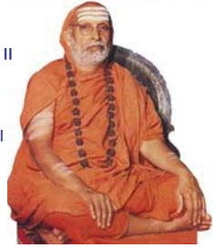
జగద్గురు శ్రీమదభినవ విద్యాత్పిఠ మహాస్వామినః

శ్లో॥ జయతు జయతు తుఙ్గాతీరగా శారదాంబా జయతు జయతు శ్రీమచ్చంద్రమౌళిస్సురేడ్యః । జయతు జయతు విఘ్నేశ్రుత్పగర్భో గణేశో- జయతు జయతు శాస్త్రం జ్యోతిషం వేదచక్షుః ॥