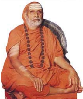
జగద్గురు శ్రీమదభినవ విద్యాతీర్థ మహాస్వామినః