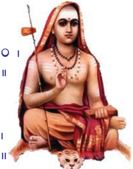
జగద్గురు శ్రీ ఆదిశంకరాచార్యః